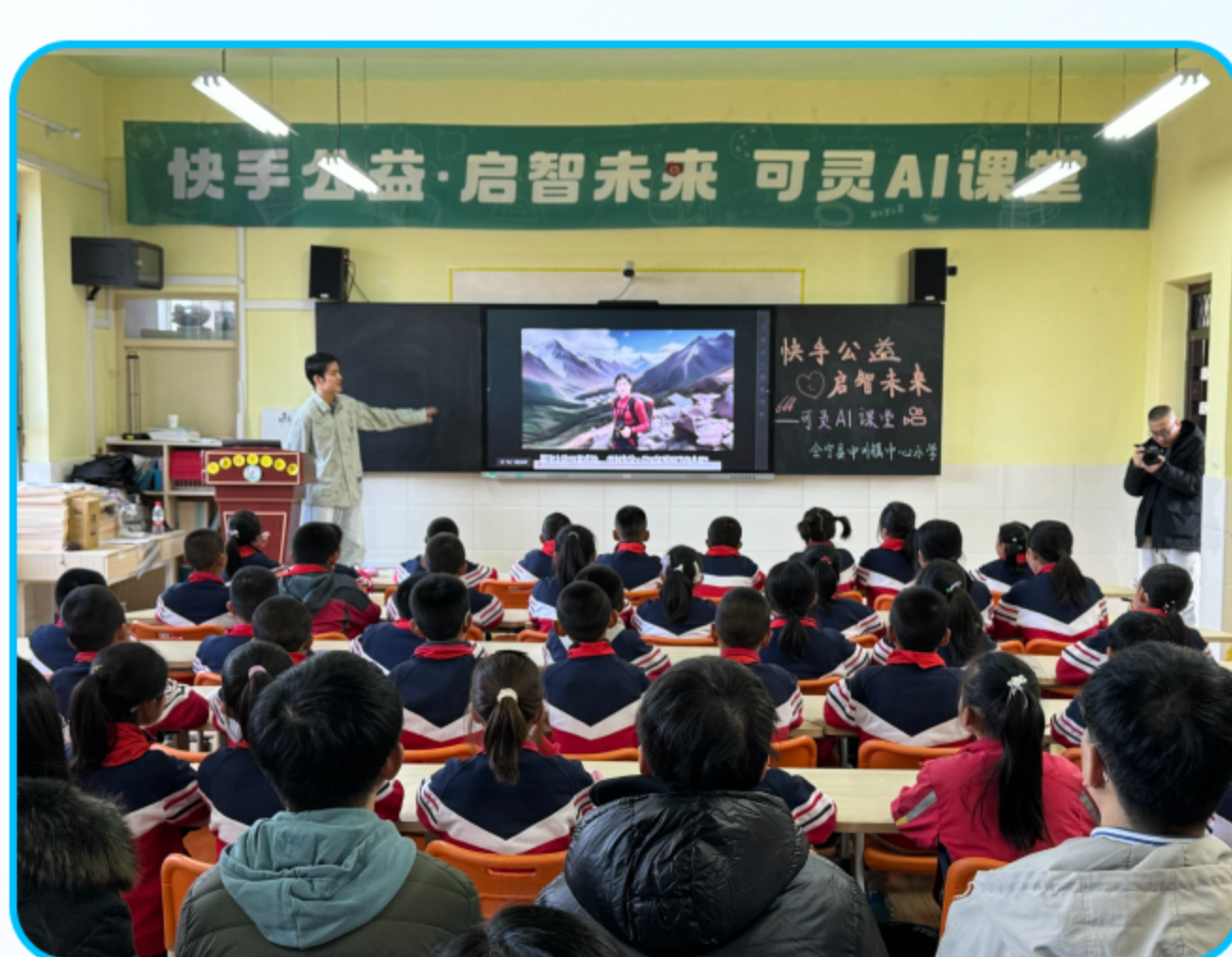
图：2024年11月“启智未来·可灵AI课堂”走进甘肃会宁

2023年起，快手公益发起“启智未来学堂”项目，在全国范围内捐建启智未来数字学堂，开展科技夏令营研学活动，让偏远地区孩子们走进北京。