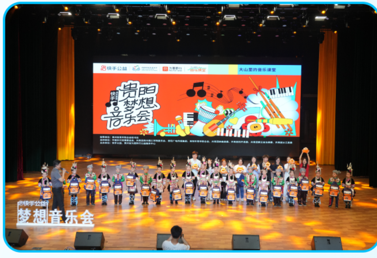
图：2024年5月“快手音乐教室·贵阳梦想音乐会”

2021年7月起，快手联合中国乡村发展基金会发起“美好学校·快手音乐课堂”项目，通过为乡村学校捐建音乐教室，协助组织音乐活动开展，为乡村儿童提供优质的音乐教育学习机会。