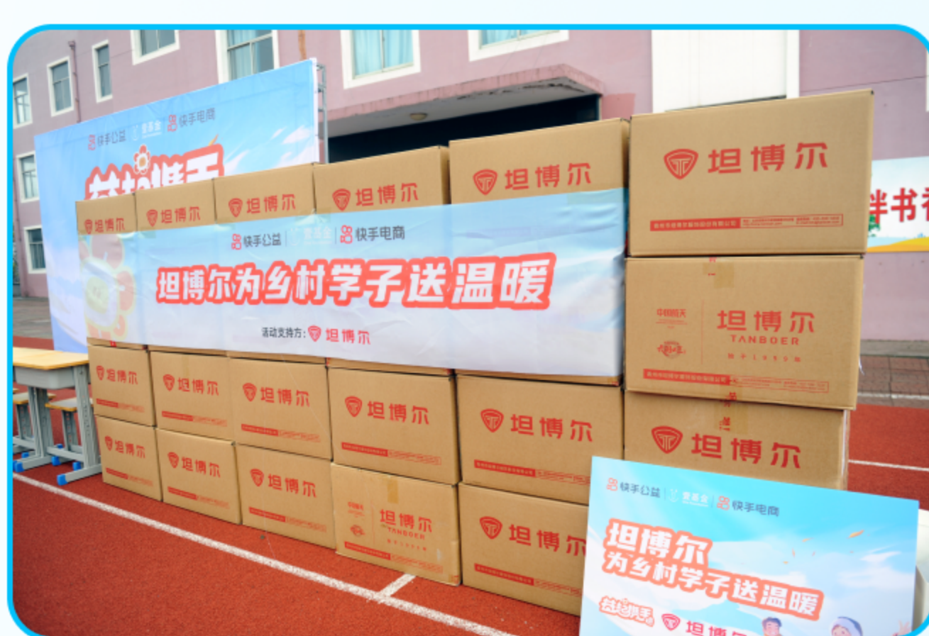
图：2024年9月“益起携手”走进广东

在开学之际，快手公益、快手电商与深圳壹基金公益基金会联合发起公益活动，向全国7个省市的12所乡村小学捐赠价值超18万元的书本书籍、文体和生活用品。