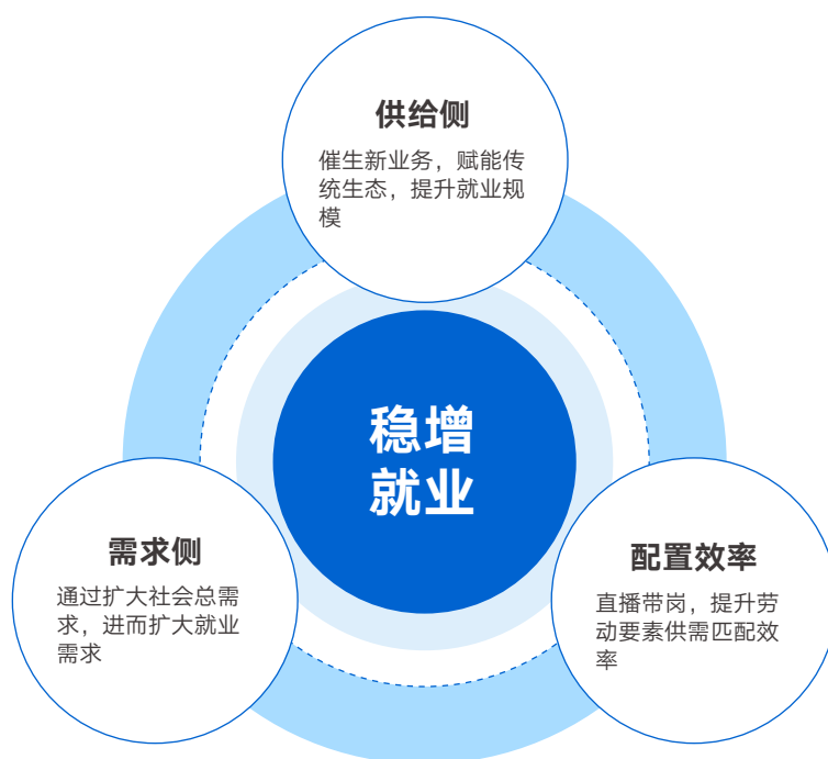
图1 快手平台稳增就业的机制

快手平台之所以可以发挥如此重要的稳增就业的作用，主要机制如下：首先，从供给侧来看，短视频和直播作为新型生产力和生产关系的典型代表，不仅催生了大量新业态，还对传统业态进行了数字化的赋能升级，因而带来了就业规模的大幅扩容。其次，从需求侧来看，以直播电商为代表的新商业模式带动了居民消费需求的大规模增长，从而通过社会总需求的扩大传导到就业需求的扩大。最后，从劳动要素配置角度来看，快手快聘创新性地推出了直播带岗的招聘模式，很大程度上提高了人力资源供求对接配置效率，最终促进了高质量充分就业。